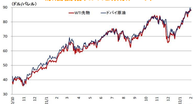
原油価格(WTIと東京ドバイ)

(注) WTI 先物は期近物。ドバイは東京原油スポット市場中東産ドバイ原油、翌月または翌々月渡し、現物、FOB、中心値 (資料) Financial Times、日本経済新聞